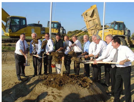
Politische Delegation beim Spatenstich am 24. September 2007 [Spatenstich_1.jpg]